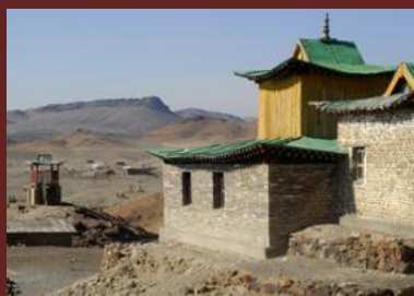
Arvaikheer - Monastère d'Ongi